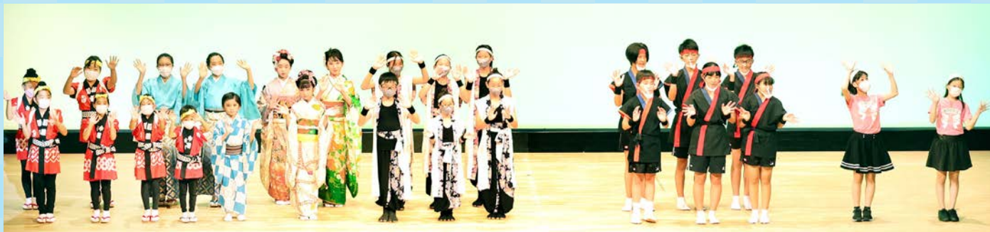
出演者がステージに集まったフィナーレ