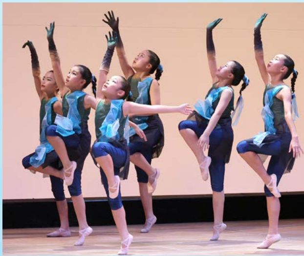
創造性に富んだ舞を披露した 日本洋舞連合J.I.D.U.の ダンススタジオスピエ