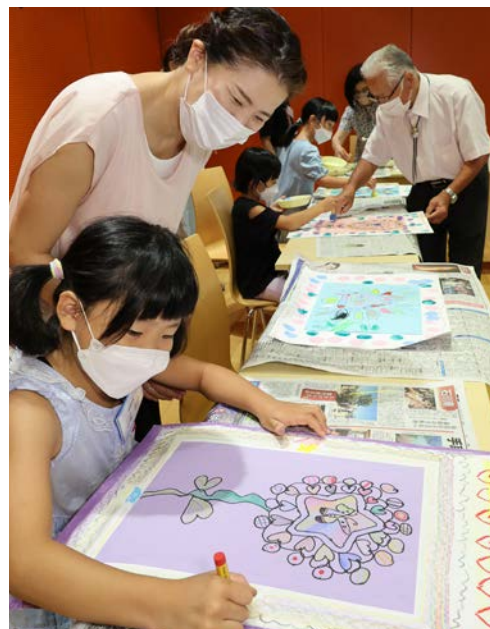
思い思いの絵を 描く子どもたち

北國新聞交流ホールでは一般財団法人県美術文化協会、北陸服装文化協会、県書美術連盟の協力でワークショップが開かれ、参加者は絵画や彫刻、クリスマスリース作り、書道を楽しみました。