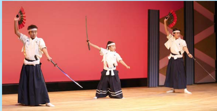
伸びやかな吟詠と勇壮な剣舞を 披露した石川県吟剣詩舞道連盟 の子どもたち