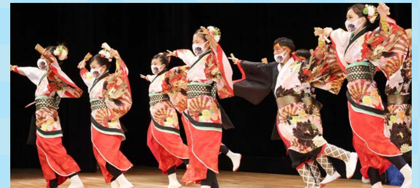
躍動するYOSAKOIソーラン 日本海組織委員会のKITA 舞人Jr.