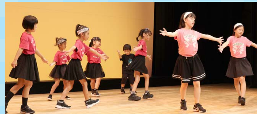
かわいらしい振り付けで会場を 盛り上げた加賀ジュニアリズム ダンス教室

フィナーレでは、出演者がステージに集まり、観客から惜しめない拍手が送られました。